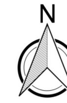
Fragment Studium uwarunkowań i kierunków zagospodarowania przestrzennego miasta i gminy Gołdap