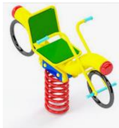
(Wizualizacja nr 2)