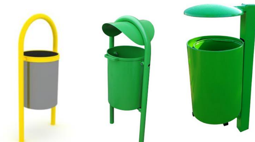
(Wizualizacja nr 3)