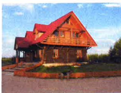
Ilustracja 14: Gospodarstwo Agroturystyczne „Puszcza Romincka”.