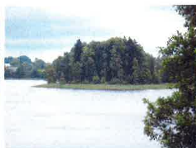
Ilustracja 6: Jezioro Ostrówek - duża wyspa