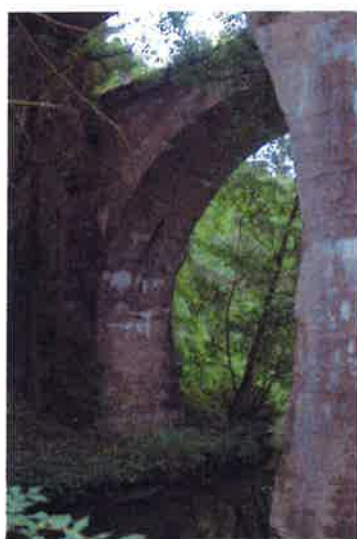
Ilustracja 11: Mosty kolejowe niopodal Botkun