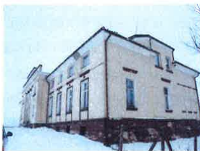
Ilustracja 9: Pałac Dworski