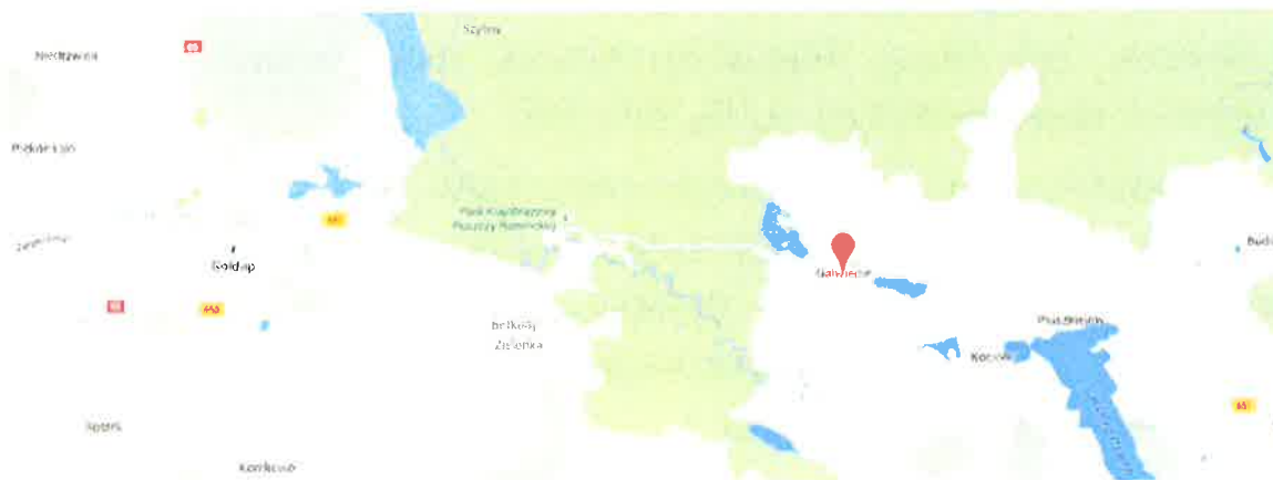
Ilustracja 1:

Jednym z największych walorów miejscowości jest środowisko naturalne. Od północnej strony wieś przylega do Puszczy Rominckiej pomiędzy jeziorami Ostrówek (24,3 ha, głębokość maks. 3,9 m i średnia: 1,9 m) i Rakówek (o pow. 24,9 ha, głębokość maks. 3,7 i średnią 1,9 m)