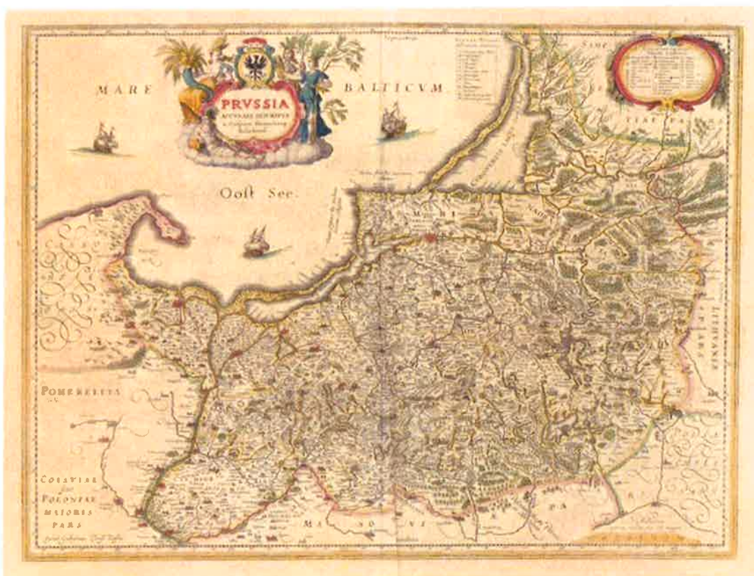
Ilustracja 2: Mapa Prus Caspara Henneberga z 1576r.

Miejscowość powstała za czasów panowania księcia Albrechta von Hohenzollerna-Ansbacha (1525-1568). Akcja osadnicza podjęta do 1540 roku zaczęła rozwijać się wzdłuż rzeki Gołdap.