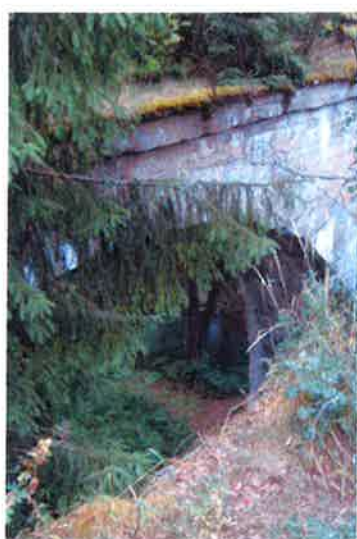
Ilustracja 10: Mosty kolejowe niopodal Botkun

- Mosty kolejowe - nieużytkowane dziś „bliźniacze” mosty kolejowe na rzece Jarce, zwane potocznie „Małymi Stańczykami”, znajdujące się nieopodal Galwiec w Sołectwie Botkuny. Są one bez wątpienia jednym z niewykorzystanych potencjałów. Okolice mostów jak i same mosty nie są zagospodarowane. Od strony Galwiec prowadzi do mostów droga, zaś same mosty i okolice są zarośnięte.