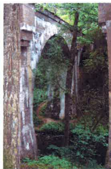
Ilustracja 12: Mosty kolejowe niopodal Botkun

- Głazy Wilhelma - pod tą nazwą kryje się 14 głazów znajdujących się w Puszczy Rominckiej (8 po stronie polskiej, 6 po stronie rosyjskiej). Nazwane od imienia króla pruskiego i cesarza niemieckiego Wilhelma II, który w 1890 roku podczas pierwszego pobytu ustrzelił tu jelenia dwunastaka. To wydarzenie zostało upamiętnione ustawieniem najstarszego znanego głazu Wilhelma. Znajduje się on aktualnie po rosyjskiej stronie puszczy. W tym samym roku Cesarz Wilhelm II ustanowił Puszcę Romincką dworskim rezerwatem łowieckim. Głazy Wilhelma oraz historia z nimi związana jest bez wątpienia zasobem o dużym potencjale turystycznym.