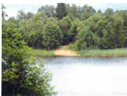
Ilustracja 5: Jezioro Ostrówek - plaża