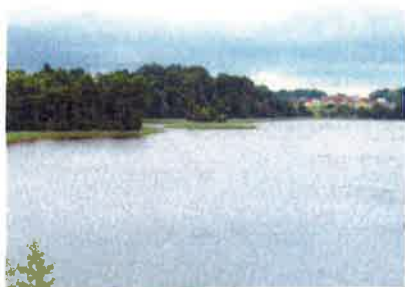
Ilustracja 4: Jezioro Ostrówek - mała wyspa

Jezioro Ostrówek oraz Wyspy na Jeziorze – jezioro Ostrówek ma powierzchnię 24,3 ha i jest jeziorem płytkim. Głębokość maksymalna jeziora sięga 3,9 m zaś średnia głębokość 1,9 m. Na jeziorze znajdują się dwie wyspy. Większa znajduje się w odległości ok 70 m od brzegu jeziora. Jej przybliżona wielkość to ok 3700 m 2 . W minionym okresie wyspa połączona była pomostem z brzegiem jeziora.