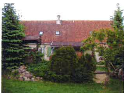
Ilustracja 13: Gospodarstwo Agroturystyczne „Trzy świerki”

W miejscowości funkcjonują dwa gospodarstwa agroturystyczne „Puszcza Romincka” i „Trzy świerki” (założone w 2000 roku jako pierwsze w powiecie gołdapskim.)