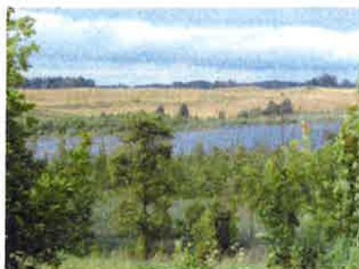
Ilustracja 7: Jezioro Rakówek

Jeziro Rakówek - o powierzchni 24,9 ha jest jeziorem stosunkowo płytkim jego maksymalna głębokość wynosi 3,7 m zaś średnia 1,9 m. Istnieje połączenie prowadzące od jeziora Ostrówek poprzez jeziro Rakówek, później rzeką Jarką, do jeziora Gołdap.