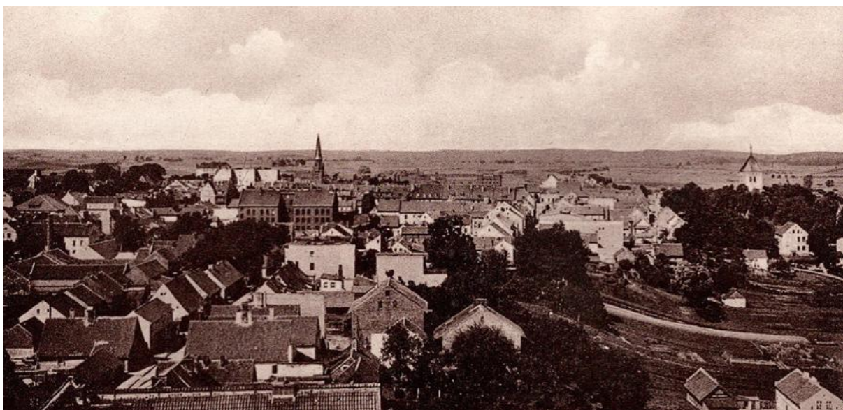
Rysunek 4. Panorama Gołdapi w 1940 r.