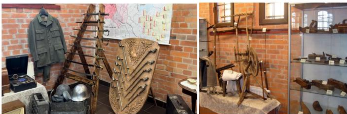
Fotografia 1. Widok na wystawę stałą Muzeum Ziemi Gołdapskiej

Muzeum Ziemi Gołdapskiej mieści się obecnie na terenie byłych koszar, dysponuje dwoma małutkimi bliźniaczymi budynkami, z których jeden przeznaczony jest na wystawę stałą, drugi na wystawy czasowe, lekcje muzealne, a ostatnio także na wydarzenia kulturalne (koncerty, przedstawienia teatralne). W budynku wystaw stałych można obejrzeć trzy kolekcje: etnograficzną, historyczną oraz geologiczną.