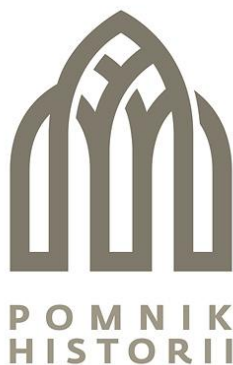
Rysunek 2. Logo pomnika historii.

Terminem tym określa się zabytek nieruchomy o szczególnych wartościach materialnych i niematerialnych oraz znaczeniu dla dziedzictwa kulturowego naszego kraju. Rangę pomnika historii podkreśla fakt, że jest on ustanawiany przez Prezydenta Rzeczypospolitej Polskiej specjalnym rozporządzeniem na wniosek Ministra Kultury i Dziedzictwa Narodowego. W treści prezydenckiego rozporządzenia wyszczególnia się cechy danego zabytku świadczące o jego najwyższej wartości, określa się precyzyjnie jego granice i zamieszcza schematyczną mapkę obiektu. Na listę Pomników Historii mogą zostać wpisane obiekty architektoniczne, krajobrazy kulturowe, układy urbanistyczne lub ruralistyczne, zabytki techniki, obiekty budownictwa obronnego, parki i ogrody, cmentarze, miejsca pamięci najważniejszych wydarzeń lub postaci historycznych oraz stanowiska archeologiczne.