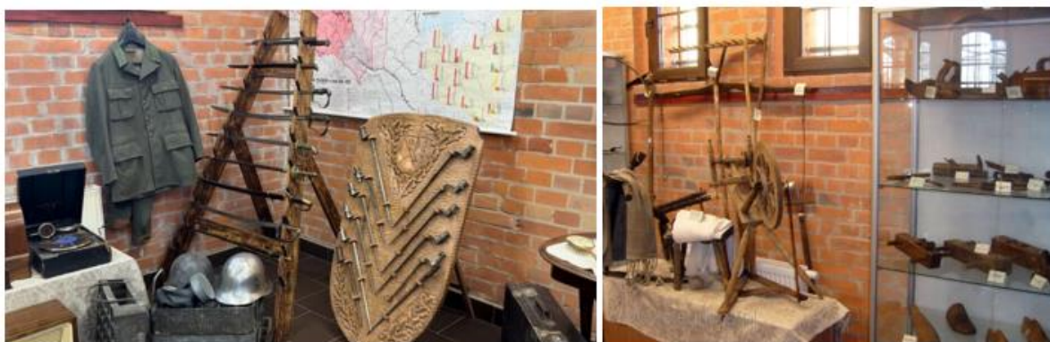
Fotografia 1. Widok na wystawę stałą Muzeum Ziemi Gołdapskiej

Muzeum Ziemi Gołdapskiej mieści się obecnie na terenie byłych koszar, dysponuje dwoma małutkimi bliźniaczymi budynkami, z których jeden przeznaczony jest na wystawę stałą, drugi na wystawy czasowe, lekcje muzealne, a ostatnio także na wydarzenia kulturalne (koncerty, przedstawienia teatralne). W budynku wystaw stałych można obejrzeć trzy kolekcje: etnograficzną, historyczną oraz geologiczną.