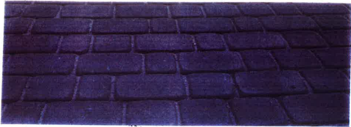
Kostka betonowa brukowa w kolorze szarym gr.8cm (wzór jak na zrealizowanych ciągach jezdnych w obrębie Promenady Zdrojowej)