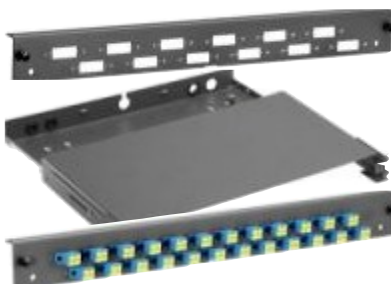
Korpus panela światłowodowego