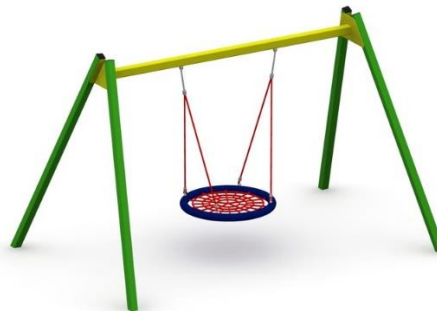
Wizualizacja nr 2