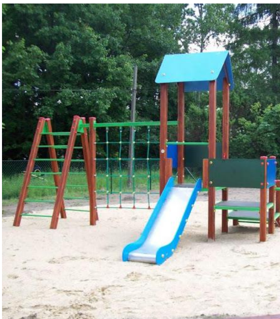
Wizualizacja nr 3