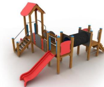
Wizualizacja nr 1