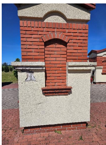
Rys. Aktualny stan techniczny zespołu kolumbariów