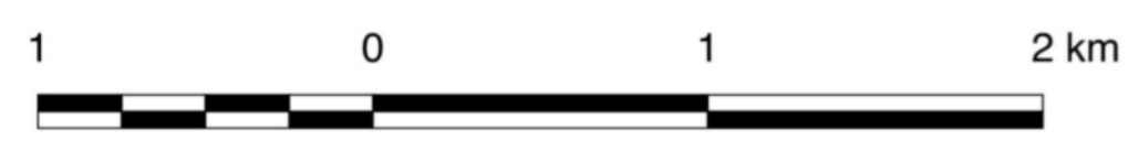
ZAŁĄCZNIK GRAFICZNY NR 1