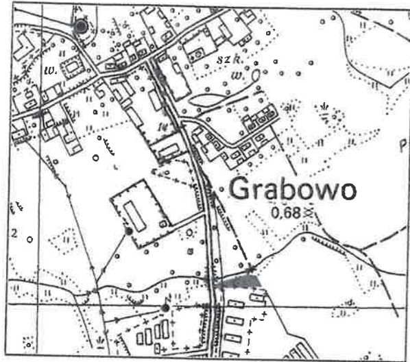
szkic orientacyjny w skali 1:10 000

Załącznik nr 1 do Zarządzenia Nr 678/LX/2016 Burmistrza Górdapi z dnia 13.09.2016r.