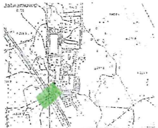
SZKIC ORIENTACYJNY SKALA 1:25000

Mapę sporządzono na podstawie materiałów archiwalnych ODGIK w Goldapi, bazy danych mapy zasadniczej i pomiaru aktualizacyjnego z dnia 04.10.2018 r.