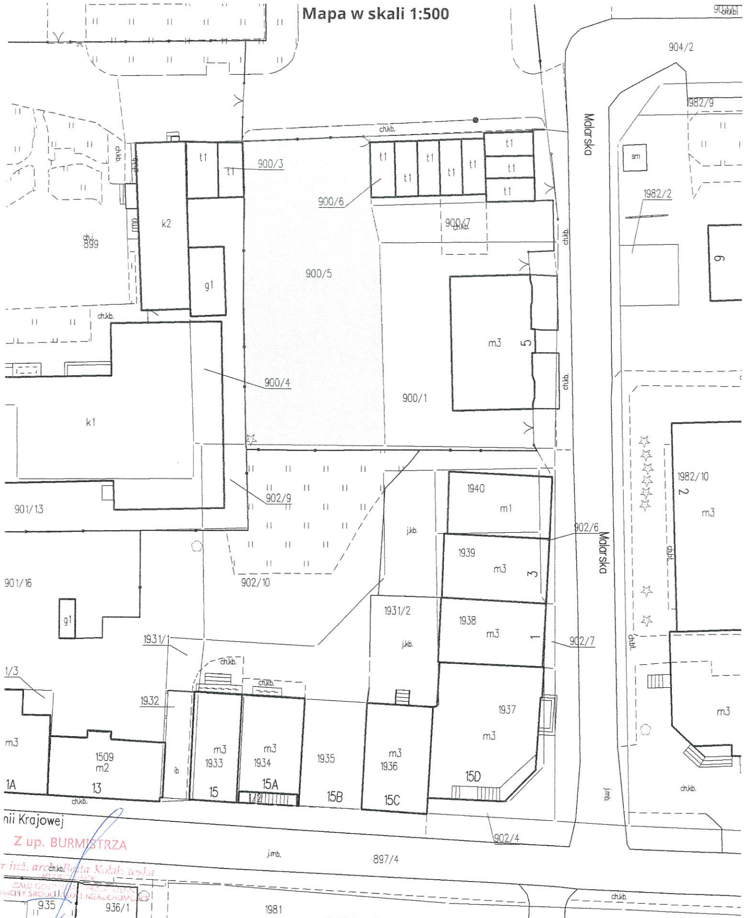
Mapa w skali 1:500

Cel wydruku: Załącznik nr 3 do Zarządzenia Nr 208/ XI / 2023